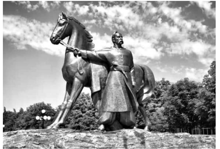
Miesto įkūrėjas, legendų gaubiamas kazokas Kreivasis Ragas.

Tai pramoninis fabrikų ir kasyklų miestas, kurio pagrindinę