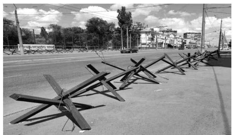
Kryvyi Rihas laikomas ilgiausiu Ukrainos miestu.