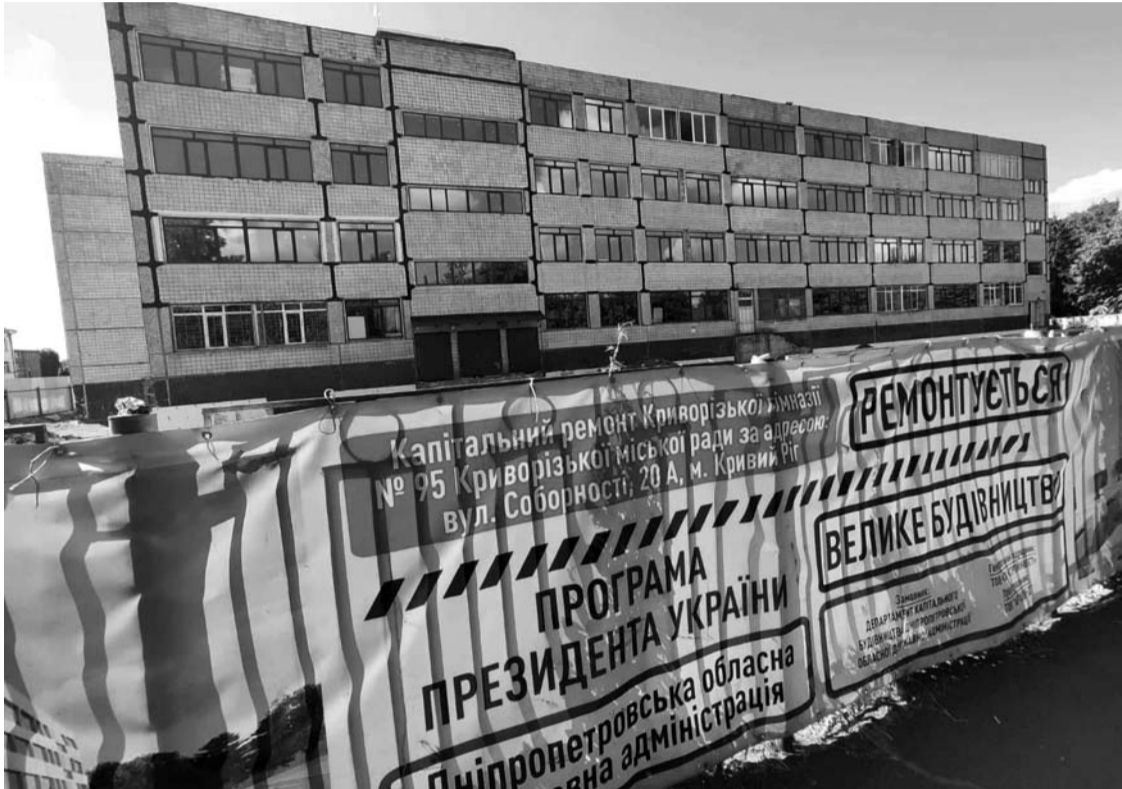
Mokykloje, kurioje mokėsi V.Zelenskis, įrengtas jam skirtas mažas muziejus, tačiau pastatas šiuo metu remontuojamas.